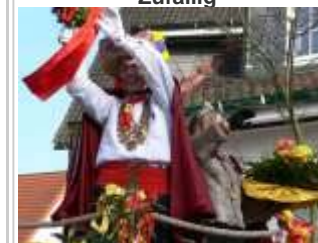
Karneval in Delbrueck 2006