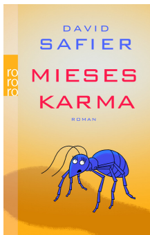
David Safier: Mieses Karma (2007)

Hier stellen wir Ihnen regelmäßig persönliche Lieblingsbücher der S(kim)-Mitarbeiterinnen und Mitarbeiter vor: